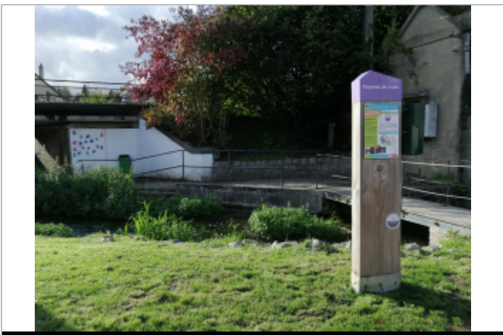
Dans l'espace Del Campo à Auffay

GÉOLOCALISATION Coordonnées WGS84 : X: 1.09819000 / Y: 49.71897100 Coordonnées RGF93 (Lambert 93) : X: 562780.88 / Y: 6959425.22 Coordonnées RGF93 (ETRS89) : X: 1.09819 / Y: 49.718971 Code Hydro: G3100600 Rive de référence: