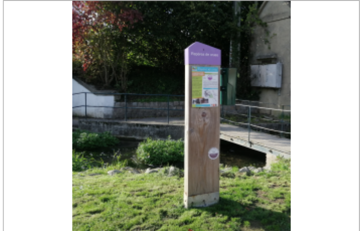
Le totem du repère de crue de l'espace Del Campo d'Auffay

MARQUE Maximum de l'inondation : Oui Visibilité : Oui État du repère : Bon Pérennité : Longue