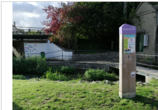
Dans l'espace Del Campo à Auffay