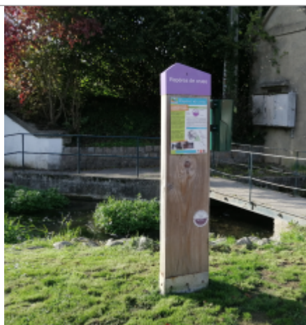
Le totem du repère de crue de l'espace Del Campo d'Auffay