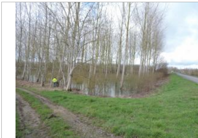
Peupliers en rive gauche entre le canal et le pont