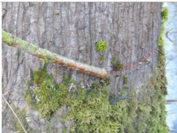
Marque sur le tronc d'un peuplier

Altitude calculée de l'eau (en m) : 109.27