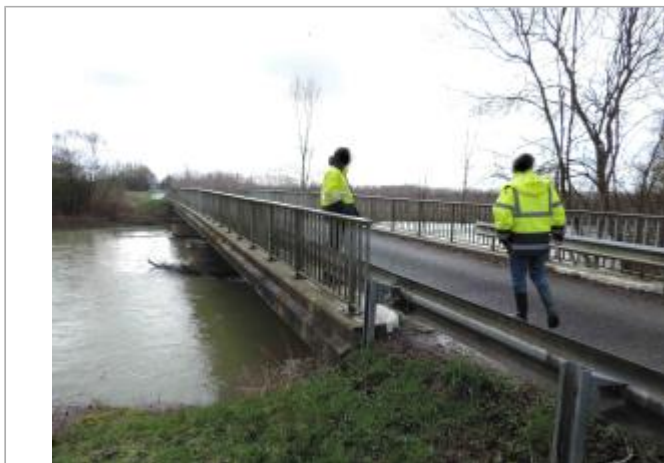
Pont sur la D58