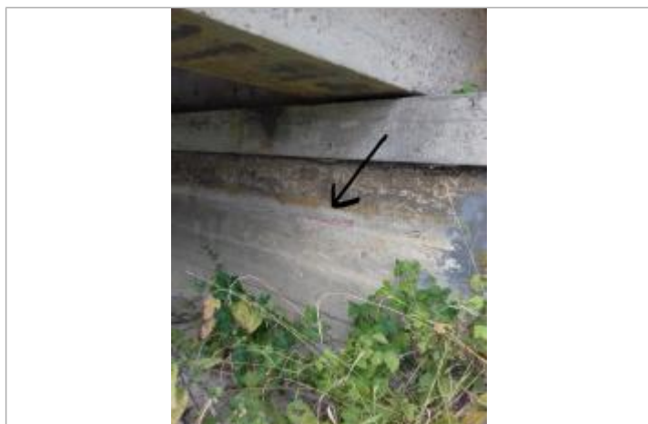
Amont rive droite du pont sur la D58

Altitude calculée de l'eau (en m) : 102.6 m