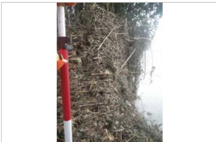
Débris végétaux sur végétation