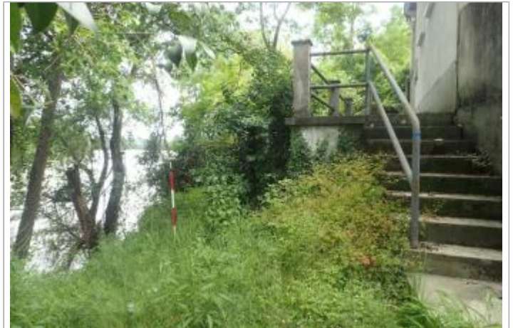
Berge rive gauche

Coordonnées WGS84 : X: 0.33660071 / Y: 44.25223340