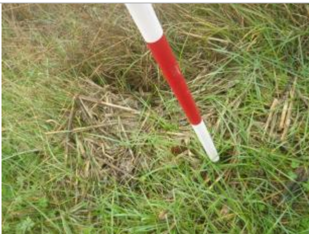
Débris végétaux sol - Photo ©AGERIN