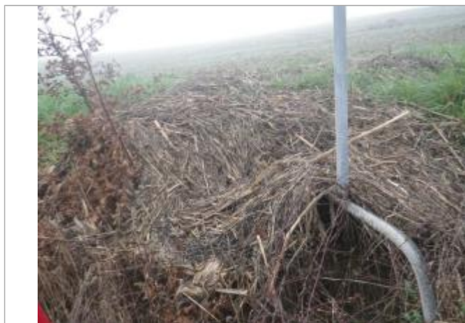
Débris végétaux poteau