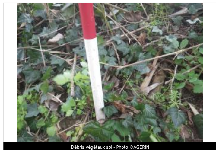
Débris végétaux sol

GÉNÉRAL Code : GTL_R_10377_1 Date de mise à jour : 12/11/2020 Auteur : SPC GTL