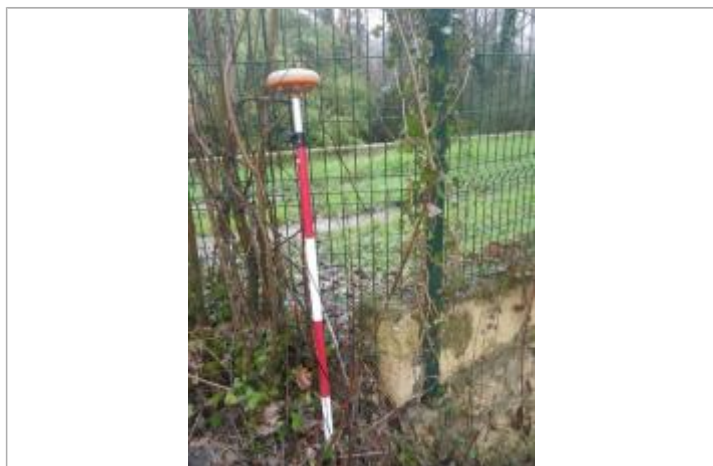
Trace de laisse grillage