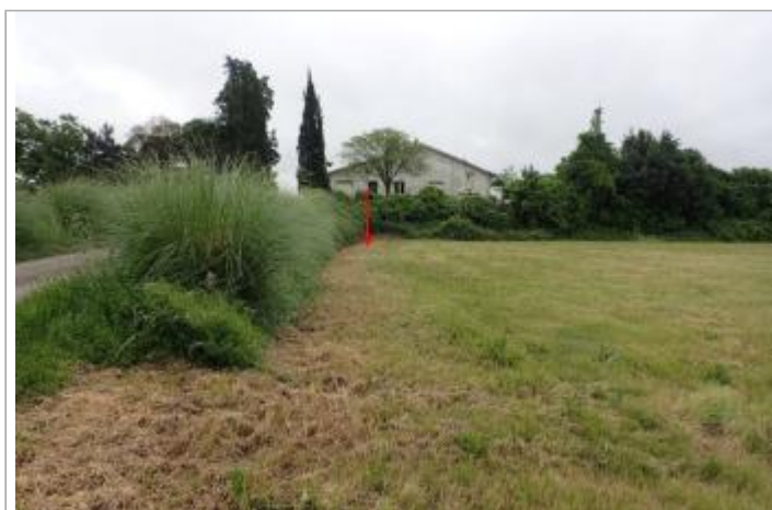
Lieu-dit Mayne

GÉOLOCALISATION Coordonnées WGS84 : X: 0.32200741 / Y: 44.30493760 Coordonnées RGF93 (Lambert 93) X: 486398.38 / Y: 6359835.11 Coordonnées RGF93 (ETRS89) : X: 0.3220074 / Y: 44.3049376 Code Hydro: O---0000 Rive de référence: Gauche