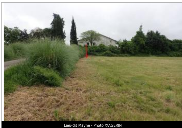
Lieu-dit Mayne

GÉOLOCALISATION Coordonnées WGS84 : X: 0.32200741 / Y: 44.30493760 Coordonnées RGF93 (Lambert 93) X: 486398.38 / Y: 6359835.11 Coordonnées RGF93 (ETRS89) : X: 0.3220074 / Y: 44.3049376 Code Hydro: O---0000 Rive de référence: Gauche