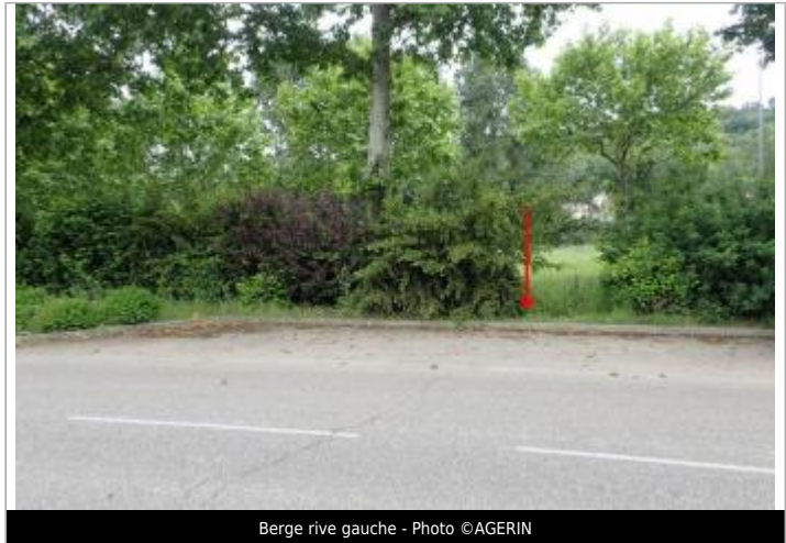
Berge rive gauche

Coordonnées WGS84 : X: 0.50797067 / Y: 44.22029950