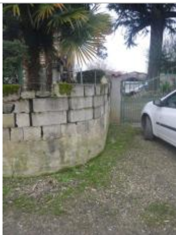
Trace de laisse muret