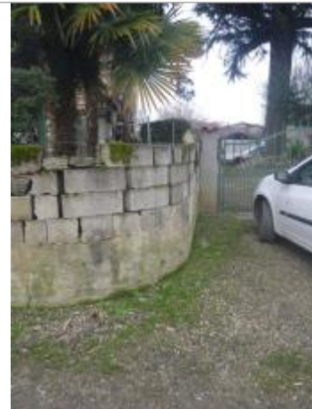
Berge rive droite