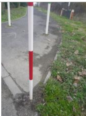
Trace laisse sol