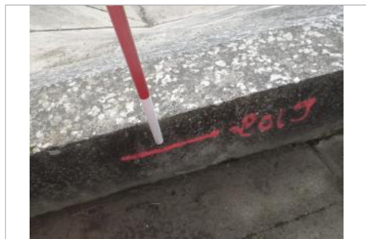
Trace de laisse digue

GÉNÉRAL Code : GTL_R_10337_1 Date de mise à jour : 12/11/2020 Auteur : SPC GTL