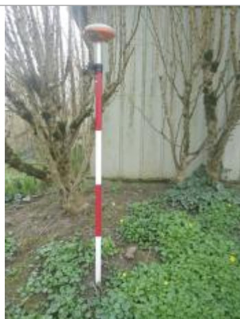
Trace mur cabane