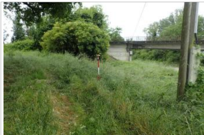
Chemin d'exploitation agricole