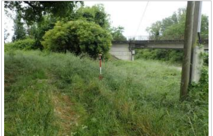
Chemin d'exploitation agricole