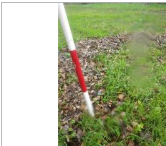
Débris végétaux sol