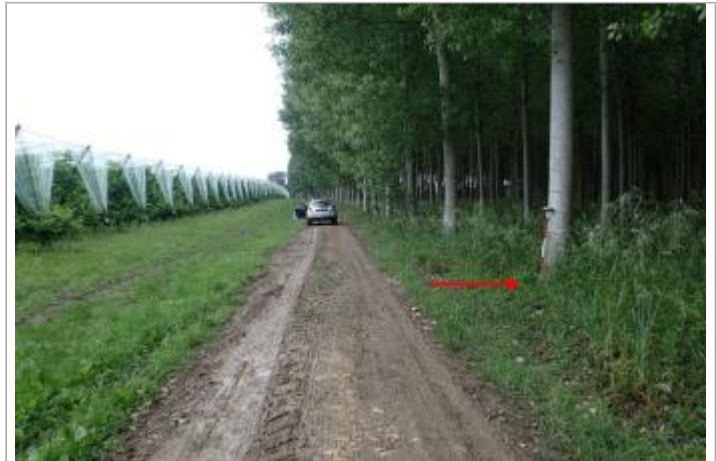
Peupleraie bord D813

Coordonnées WGS84 : X: 0.79644460 / Y: 44.14233750