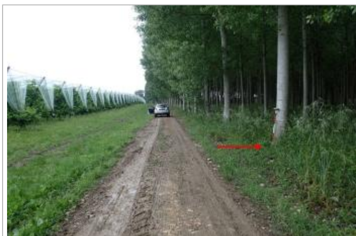
Peupleraie bord D813

GÉOLOCALISATION Coordonnées WGS84 : X: 0.79644460 / Y: 44.14233750 Coordonnées RGF93 (Lambert 93) X: 523725.43 / Y: 6340607.7 Coordonnées RGF93 (ETRS89) : X: 0.7964446 / Y: 44.1423375 Code Hydro: O--0000 Rive de référence: Droite