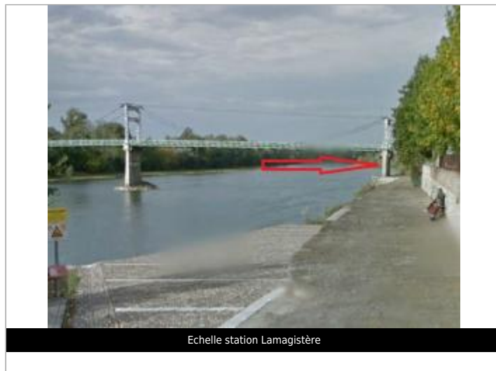
Echelle station Lamagistère