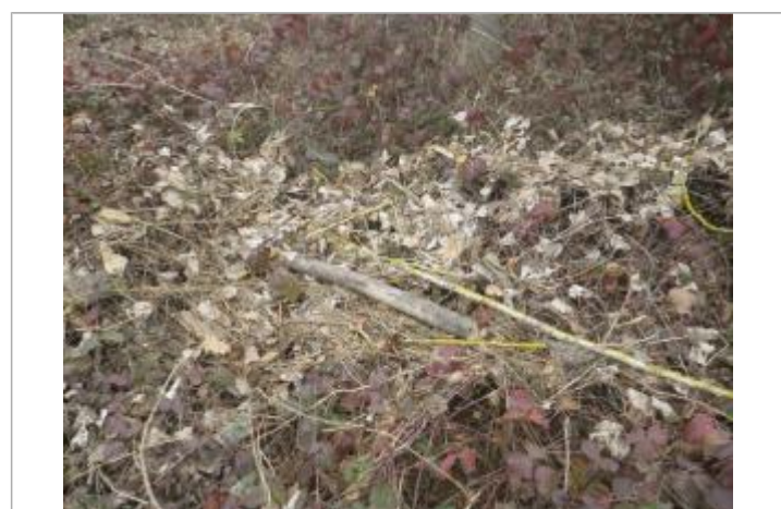
Débris végétaux au sol