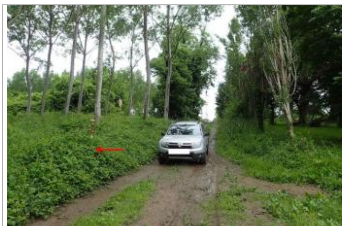
Peupleraie chemin de la Caton