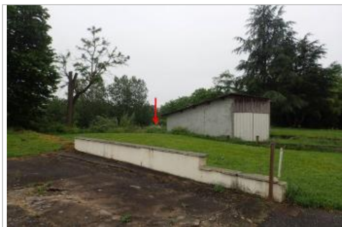
Garage rue Pasteur

GÉOLOCALISATION Coordonnées WGS84 : X: 0.81451463 / Y: 44.12496670 Coordonnées RGF93 (Lambert 93) X: 525117.17 / Y: 6338638.3 Coordonnées RGF93 (ETRS89) : X: 0.8145146 / Y: 44.1249667 Code Hydro: O---0000 Rive de référence: Droite