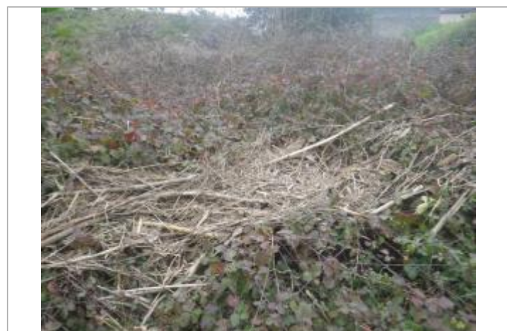
Débris végétaux sur végétation

GÉNÉRAL Code : GTL_R_10297_1 Date de mise à jour : 20/11/2020 Auteur : SPC GTL