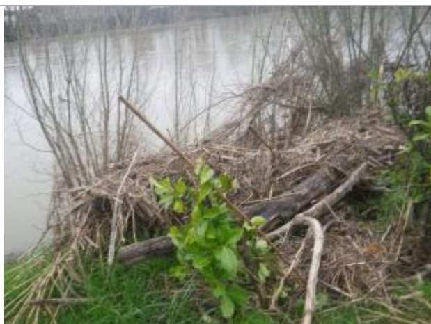
Débris végétaux sur végétation