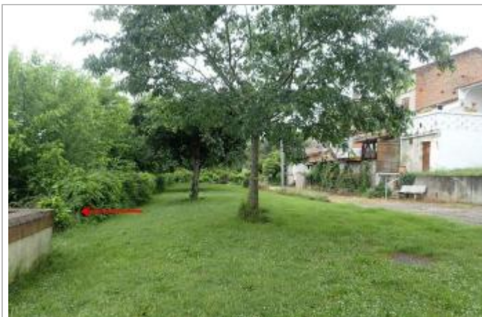
Berge rive droite quai Chauderon

Coordonnées WGS84 : X: 0.81735600 / Y: 44.12441070