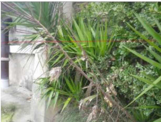
Débris végétaux sur végétation