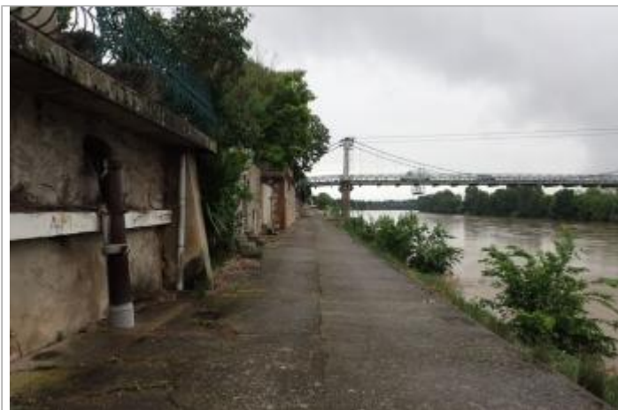
Quai Chauderon