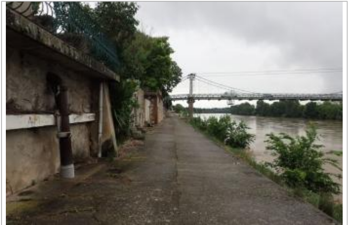
Quai Chauderon