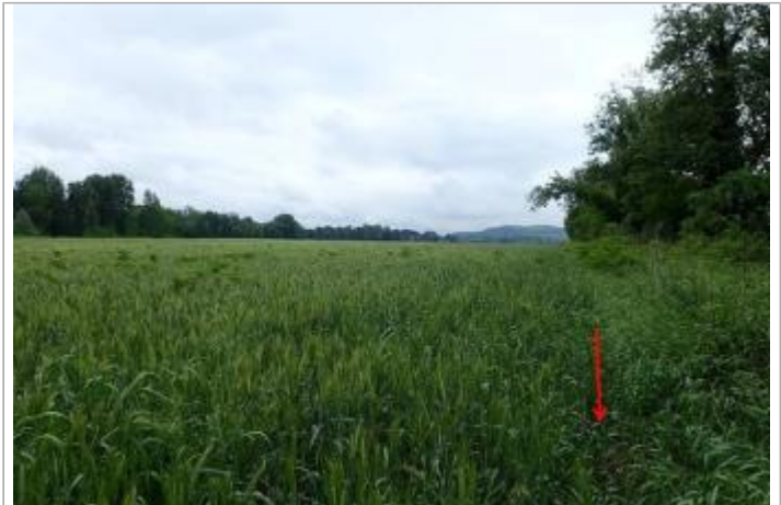
Champs entre la Séoune et la Garonne

Coordonnées WGS84 : X: 0.67361221 / Y: 44.16288940