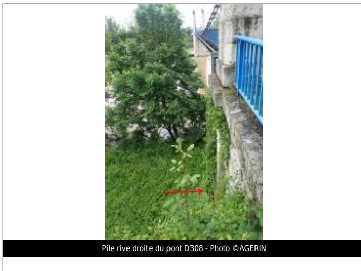
Pile rive droite du pont D308