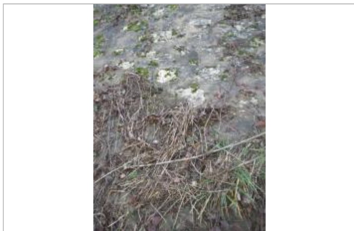
Débris végétaux sur muret