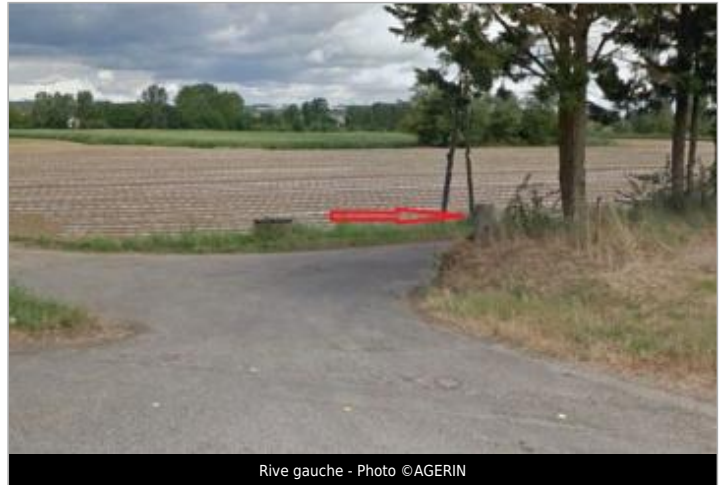
Rive gauche

Coordonnées WGS84 : X: 0.82254223 / Y: 44.11924090