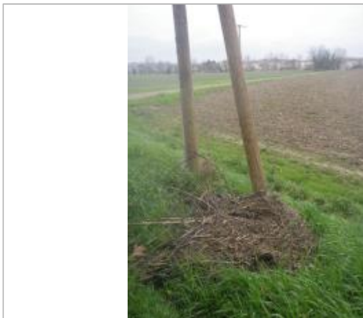
Débris végétaux sol