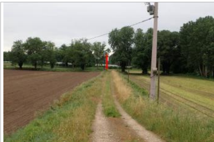
Lieu-dit Bordet

Coordonnées WGS84 : X: 0.81715026 / Y: 44.12239190