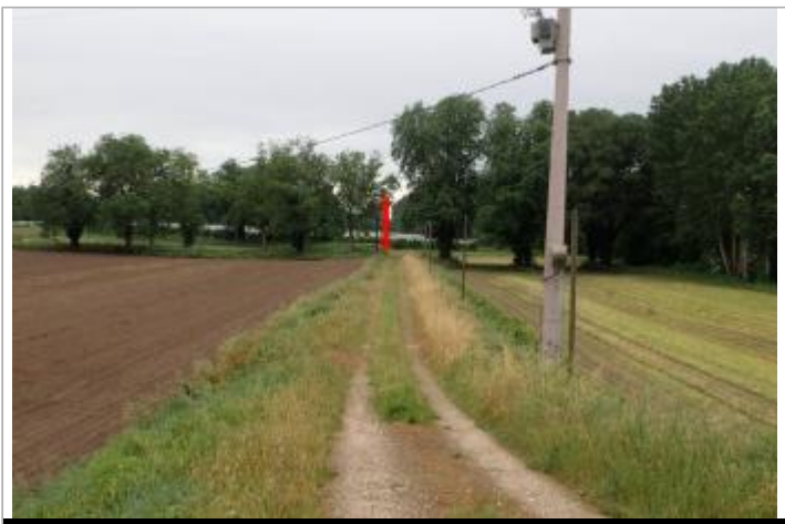
Lieu-dit Bordet

GÉOLOCALISATION Coordonnées WGS84 : X: 0.81715026 / Y: 44.12239190 Coordonnées RGF93 (Lambert 93) X: 525320.11 / Y: 6338346.5 Coordonnées RGF93 (ETRS89) : X: 0.8171503 / Y: 44.1223919 Code Hydro: O--0000 Rive de référence: Gauche