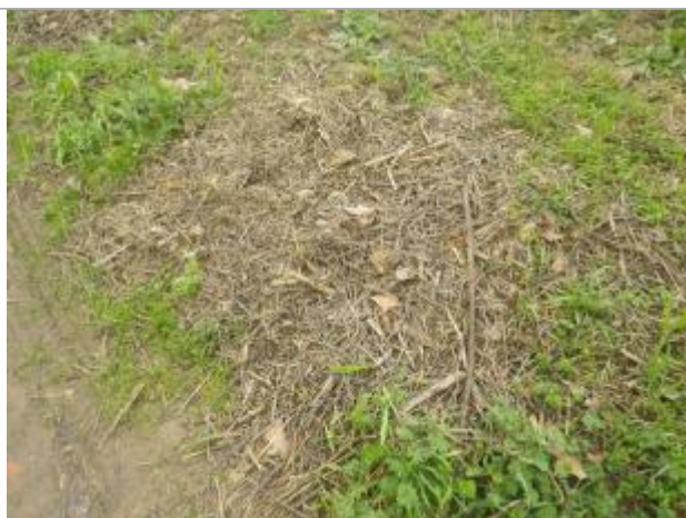
Débris végétaux sol