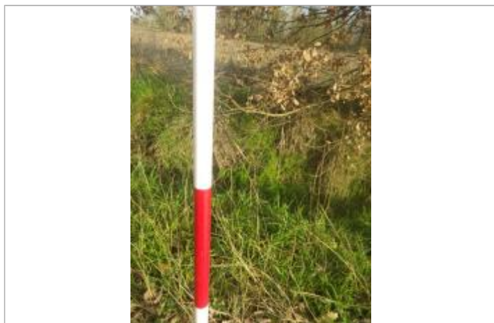
Débris végétaux sur végétation - Photo ©AGERIN