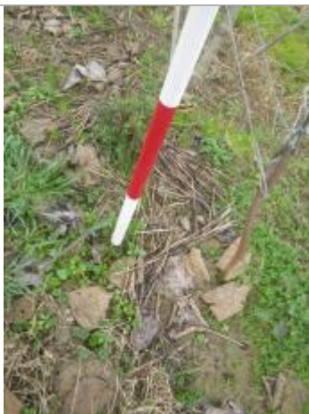
Débris végétaux sol