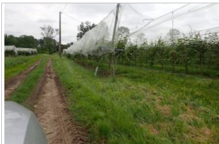
Vergers la Bourdette

GÉOLOCALISATION Coordonnées WGS84 : X: 0.42280068 / Y: 44.23743000 Coordonnées RGF93 (Lambert 93) X: 494190.19 / Y: 6352071.74 Coordonnées RGF93 (ETRS89) : X: 0.4228007 / Y: 44.23743 Code Hydro: O---0000 Rive de référence: Droite