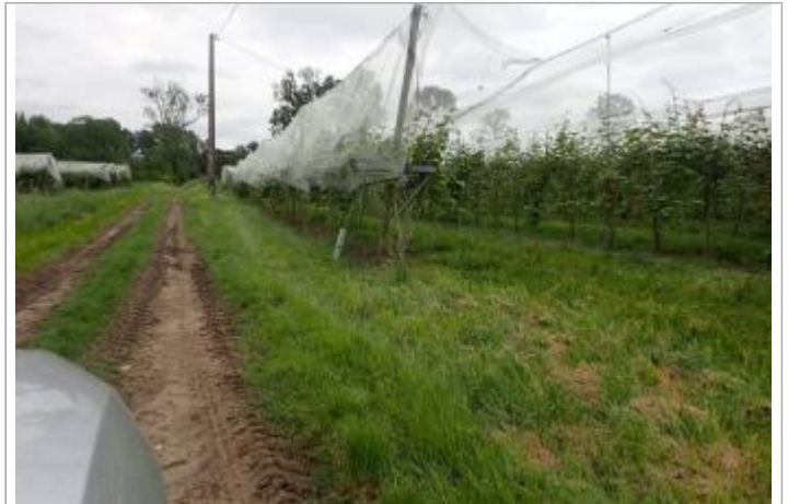
Vergers la Bourdette