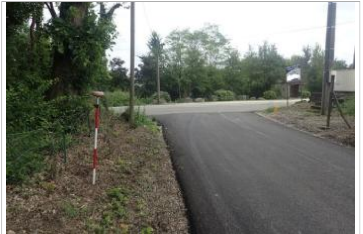
Berge rive gauche Baise