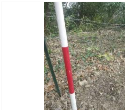
Débris végétaux sol

Altitude calculée de l'eau (en m) : 32.93 m