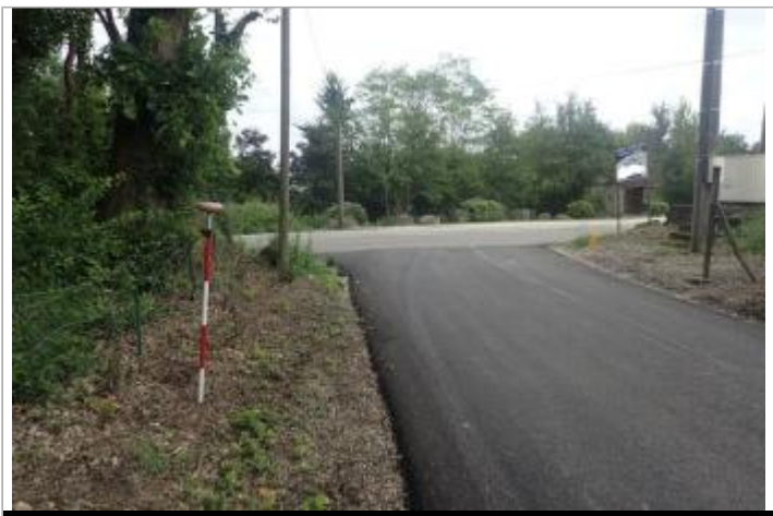
Berge rive gauche Baïse - Photo ©AGERIN

GÉOLOCALISATION Coordonnées WGS84 : X: 0.30173748 / Y: 44.26271960 Coordonnées RGF93 (Lambert 93) X: 484622 / Y: 6355202.65 Coordonnées RGF93 (ETRS89) : X: 0.3017375 / Y: 44.2627196 Code Hydro: O6--0290 Rive de référence: Gauche