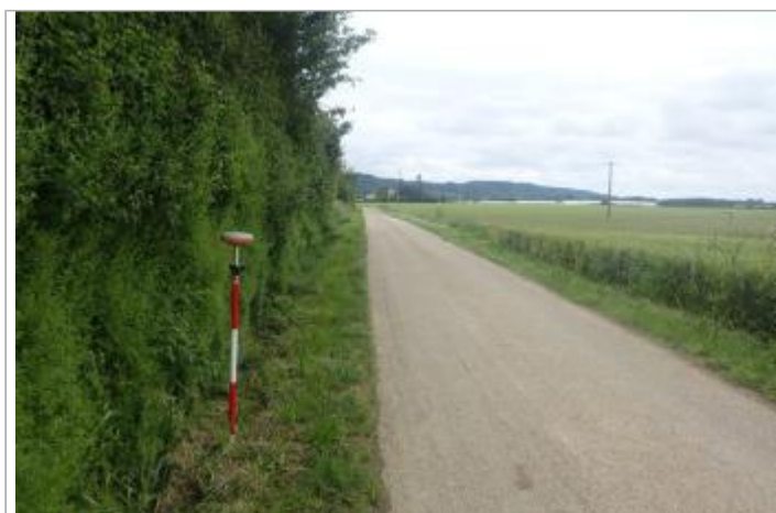
Berge rive droite Baïse

GÉOLOCALISATION Coordonnées WGS84 : X: 0.31242892 / Y: 44.26398360 Coordonnées RGF93 (Lambert 93) X: 485479.85 / Y: 6355313.89 Coordonnées RGF93 (ETRS89) : X: 0.3124289 / Y: 44.2639836 Code Hydro: O6--0290 Rive de référence: Droite