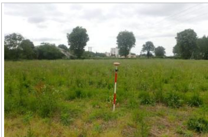
Berge rive droite Baïse