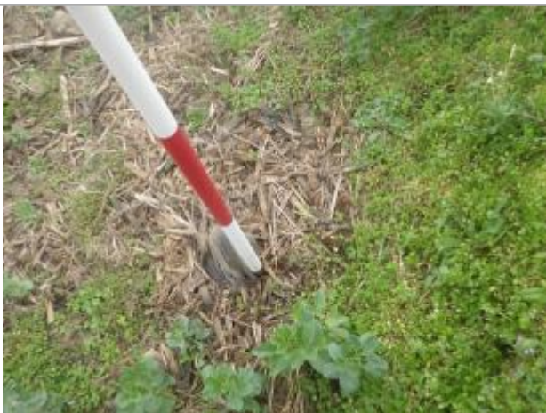
Débris végétaux sol

Altitude calculée de l'eau (en m) : 33.39 m