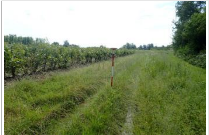
Berge rive gauche Baïse

Coordonnées WGS84 : X: 0.32417482 / Y: 44.25112460