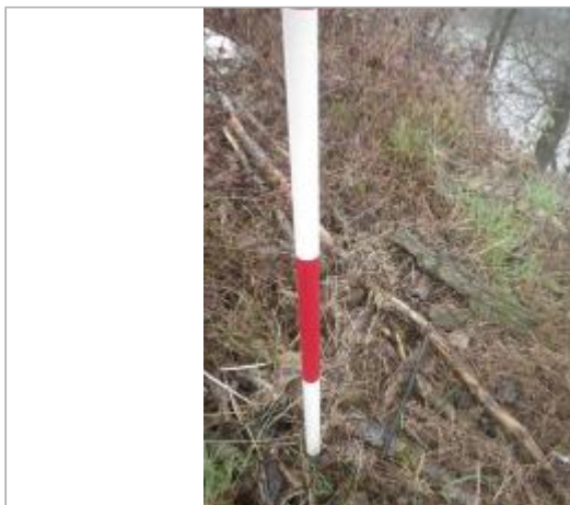
Berge rive gauche

Coordonnées WGS84 : X: 0.53302562 / Y: 44.21351830