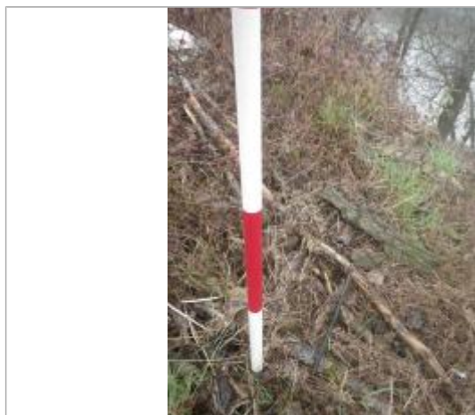
Débris végétaux sol