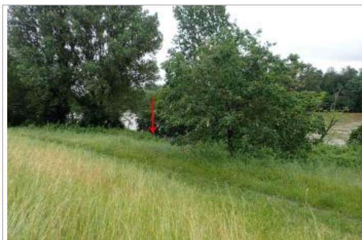
Chemin longeant la D443 au bord de la Garonne

GÉOLOCALISATION Coordonnées WGS84 : X: 0.66341580 / Y: 44.15803220 Coordonnées RGF93 (Lambert 93) X: 513138.33 / Y: 6342656.6 Coordonnées RGF93 (ETRS89) : X: 0.6634158 / Y: 44.1580322 Code Hydro: O---0000 Rive de référence: Droite