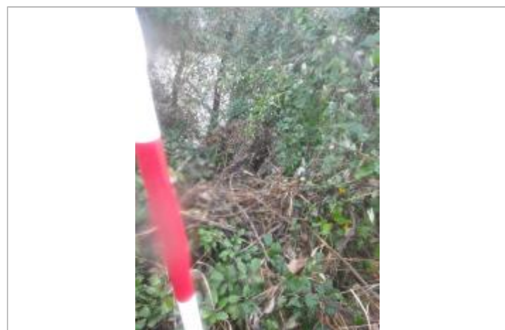
Débris végétaux sur la berge

GÉNÉRAL Code : GTL_R_10236_1 Date de mise à jour : 13/11/2020 Auteur : SPC GTL