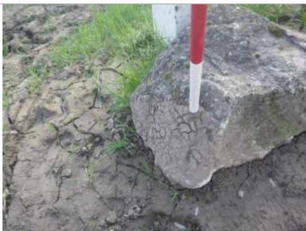
Trace de laisse sol

Altitude calculée de l'eau (en m) : 31.56 m