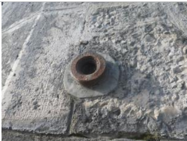
Plaque muret pont

Altitude calculée de l'eau (en m) : 33.35 m