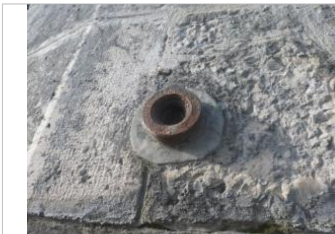
Plaque muret pont

Altitude calculée de l'eau (en m) : 33.35 m