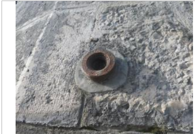
Berge rive gauche

Coordonnées WGS84 : X: 0.34288283 / Y: 44.30438310