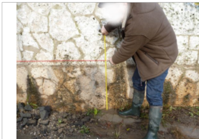
Laisse d'inondation sur le mur