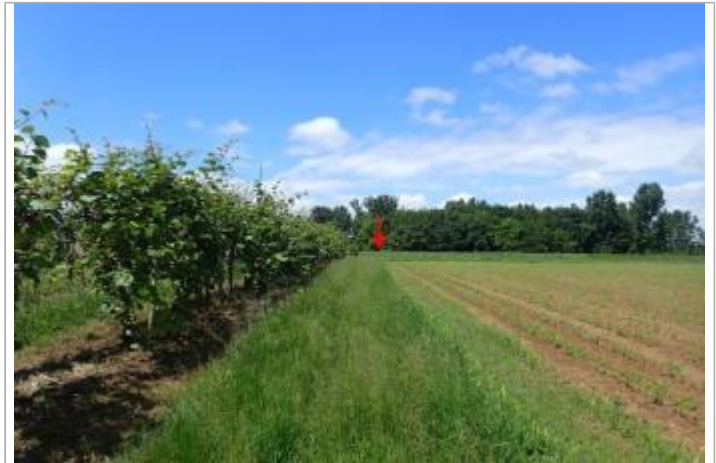
Digue rive droite

Coordonnées WGS84 : X: 0.32524909 / Y: 44.30219150