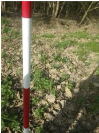
Débris végétaux sol