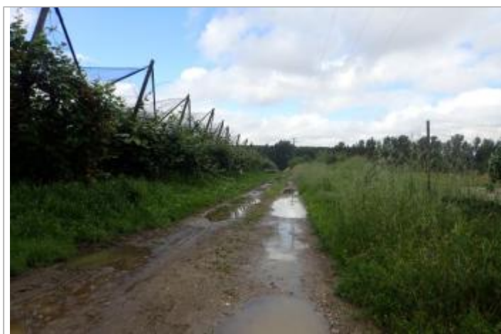
Vergers Goux

GÉOLOCALISATION Coordonnées WGS84 : X: 0.56076437 / Y: 44.21853710 Coordonnées RGF93 (Lambert 93) X: 505139.25 / Y: 6349623.79 Coordonnées RGF93 (ETRS89) : X: 0.5607644 / Y: 44.2185371 Code Hydro: O---0000 Rive de référence: Gauche