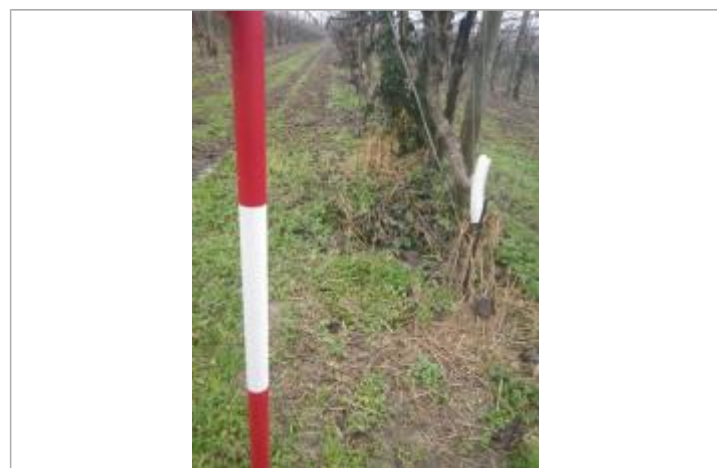
Débris végétaux dans Vergers

GÉNÉRAL Code : GTL_R_10218_1 Date de mise à jour : 13/11/2020 Auteur : SPC GTL