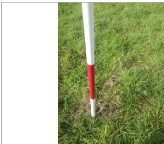
Débris végétaux sol - Photo ©AGERIN