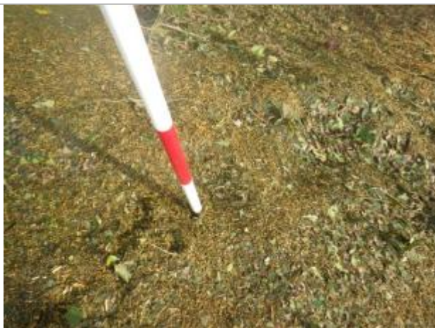
Débris végétaux sur sol

Altitude calculée de l'eau (en m) : 43.84 m