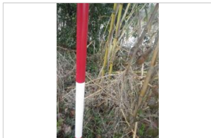
Débris végétaux sur végétation - Photo ©AGERIN

GÉNÉRAL Code : GTL_R_10206_1 Date de mise à jour : 12/11/2020 Auteur : SPC GTL