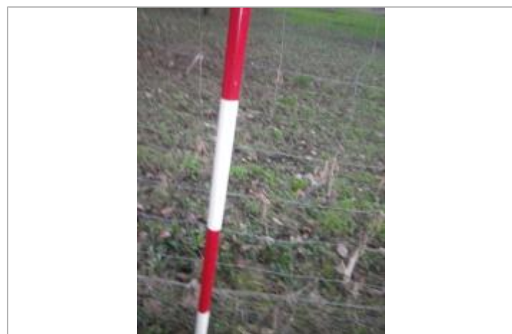
Débris végétaux sur le grillage

GÉNÉRAL Code : GTL_R_10204_1 Date de mise à jour : 12/11/2020 Auteur : SPC GTL