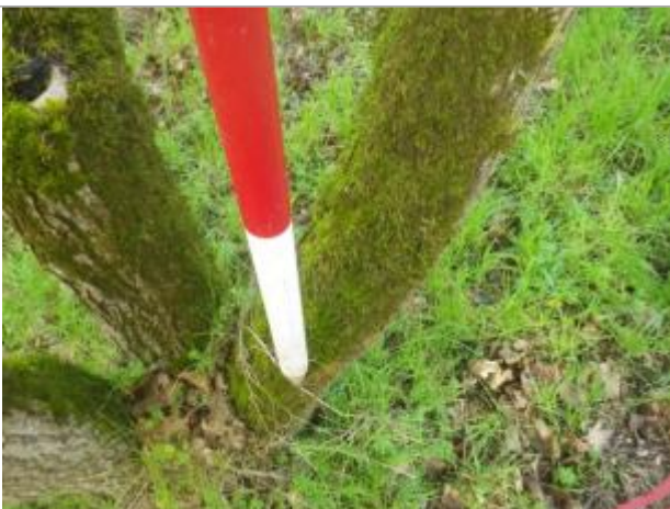
Débris végétaux sur arbre

Altitude calculée de l'eau (en m) : 42.9 m