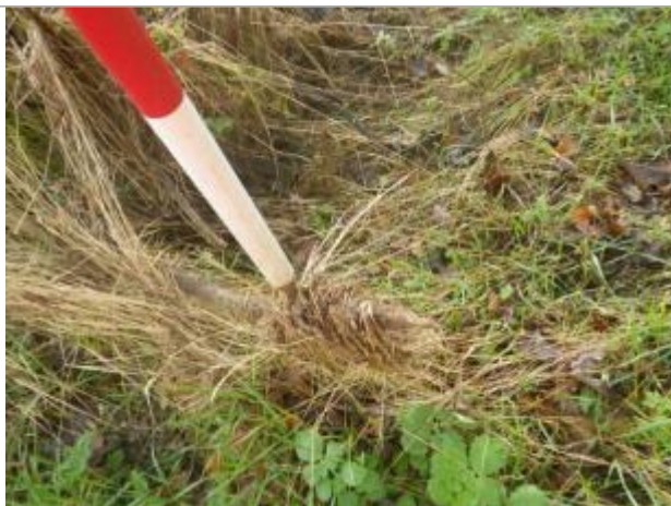
Débris végétaux sur sol

Altitude calculée de l'eau (en m) : 44.53 m