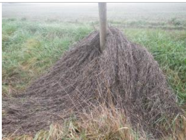
Débris végétaux poteau