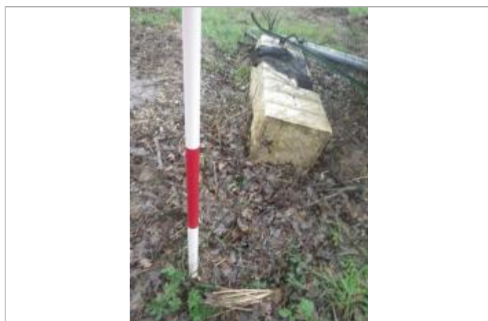
Débris végétaux sol

Code : GTL_R_10374_1 Date de mise à jour : 03/12/2020 Auteur : SPC GTL