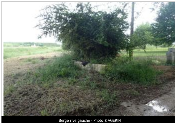
Berge rive gauche