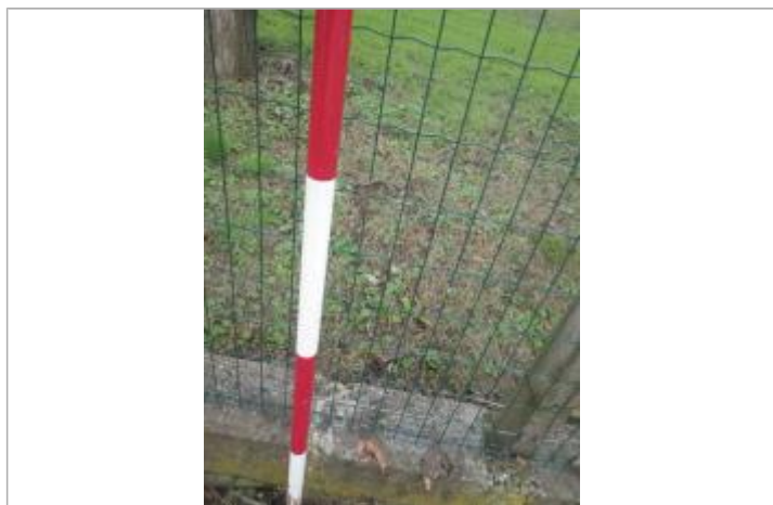
Débris végétaux grillage

Maximum de l'inondation : Non Visibilité : Non renseigné État du repère : Non renseigné Pérennité : Non renseigné Repère calculé : Non renseigné PHEC : Non renseigné