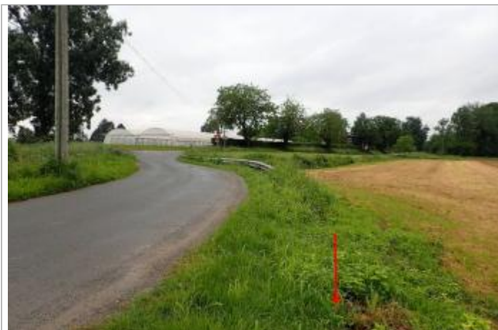
Champs lieu-dit Estube