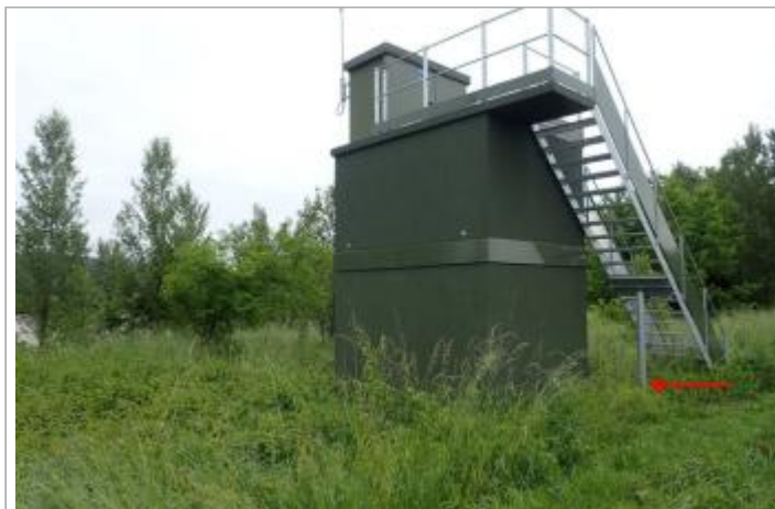
Station rive gauche