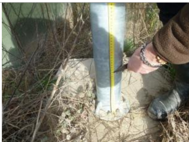
Laisse de crue sur le poteau